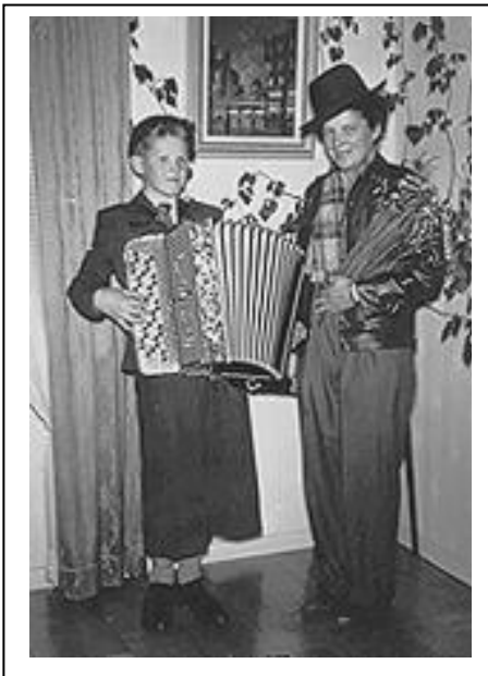
"Bildern" Jag spelar på en soaré 1958

När jag var 13 år så sa min ene farbror när spelmanslaget skulle spela till dans vid ett tillfälle att låt pojken följa med, oj vad spännande det var, jag hade lärt mig lite om harmonier så jag klarade mig rätt bra på det viset.