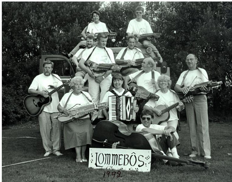
Lommebôs 1990, vi lånade en gammal brandbil och åkte till Danmark med.

Vi samarbetar och träffas nästan varje år, vi har varit Scotland 4 gånger tror jag, och det fortsätter, detta året skall vi till Sunne i Värmland.